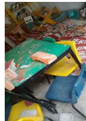
Puente de Ixtla, Morelos