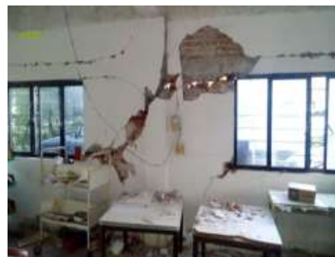
Santiago Astata, Oaxaca