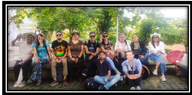
Visita Zona Norte