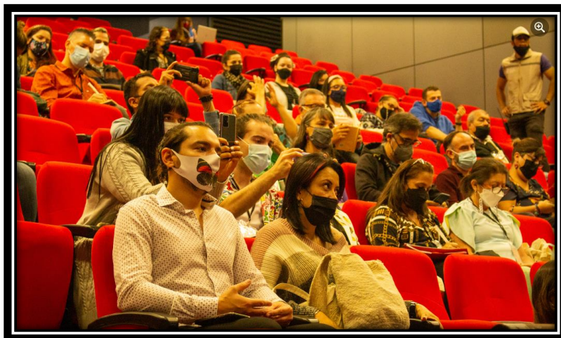
Charlas y conferencias